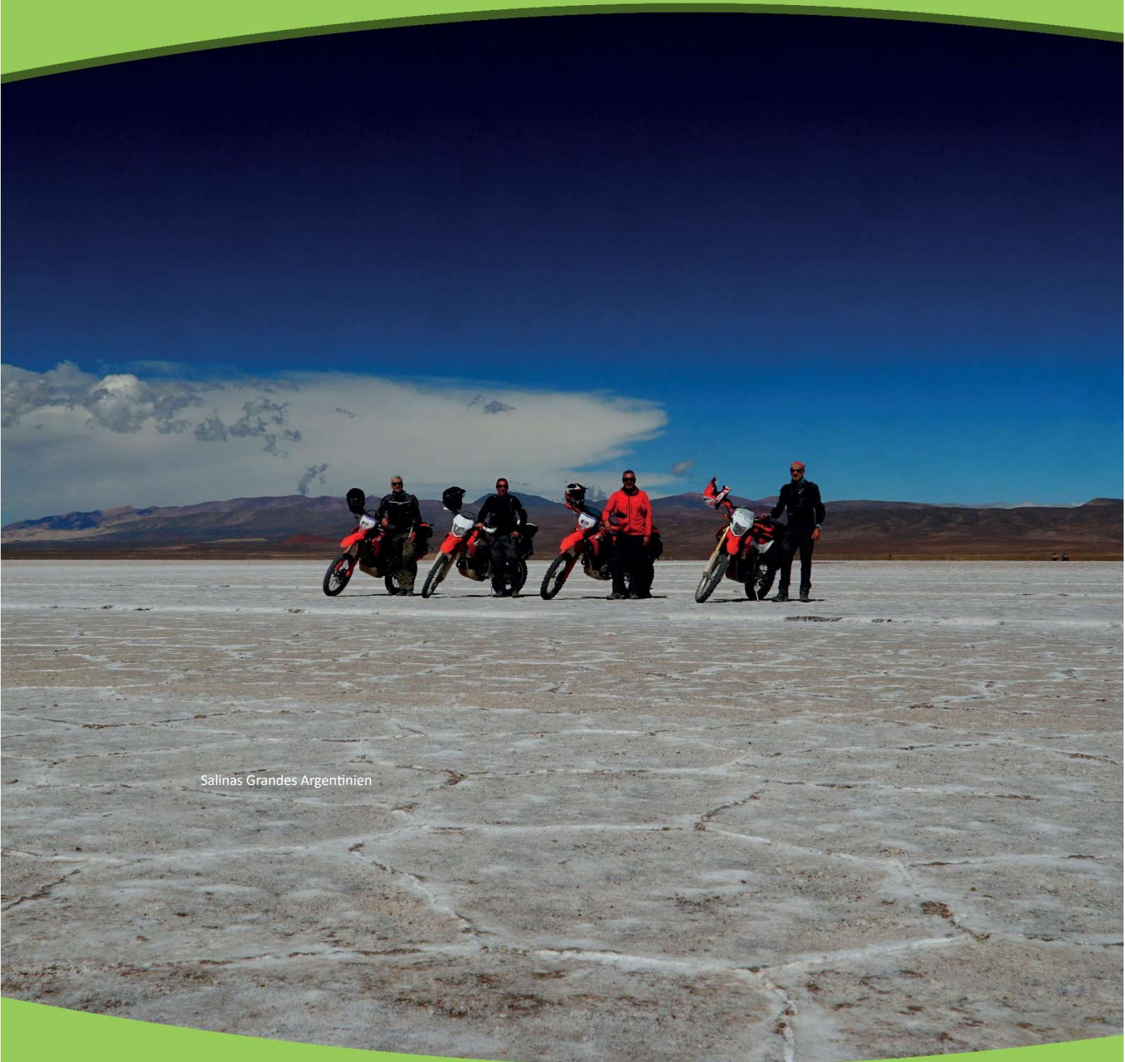
Salinas Grandes Argentinien